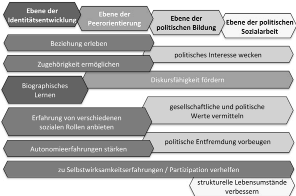
Abbildung 1: Sozialisationsziele ausgewählter Handlungsebenen in der Arbeit mit UMF in Abgrenzung, Übereinstimmung und synergetischen Nutzen.